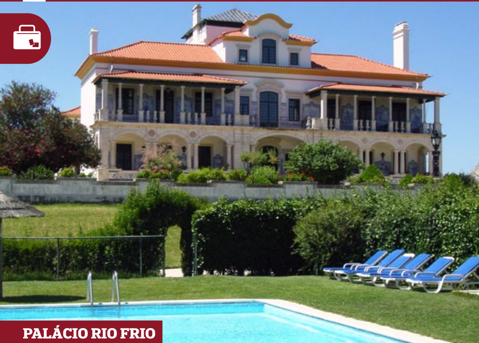
PALÁCIO RIO FRIO