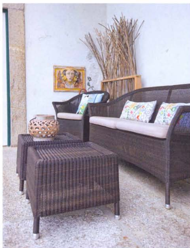
Neben drei Zimmern mit historischem Mobiliar im Haupthaus, gibt es auf dem Gelände der Quinta auch moderne Apartments. Das Hauptportal des Gutes krönt das Familienwappen mit einem Kreuz. Krone und Kreuz sind Hinweise auf den Rang des Adelsgeschlechts.