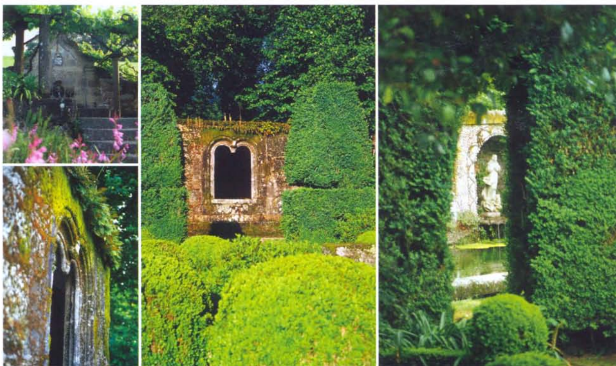
Es sind die Details, die zählen. Verwitterte Steinstufen, berankte Pergolen, Wandbrunnen, Fontänen und kleine Grotten zeugen von vergangenen Zeiten. Besonders charmant wirken sie durch die Patina aus Moos und Flechten.

DIE WECHSELHAFTE GESCHICHTE Nordportugals und damit der portugiesischen Gärten orientiert sich an der Kultur der Araber sowie den Vorbildern antiker und römischer Villengärten. Für beide typisch ist die Anlage in Innenhöfen, die von überdachten Säulengängen umschlossen sind. Das sorgte für einen fließenden Übergang von drinnen nach draußen und das Vorhandensein von schattigen Plätzen für heiße Tage. In Casa do Campo können Übernachtungsgäste neben dem erhöht liegenden Kameliengarten auch einen solchen Innenhof nutzen. Der schwere Duft der Zitrusbäume lässt sich von der heißen Luft durch den Innenhof tragen, leise plätschert in einer Ecke Wasser aus einem Speier in ein Becken.