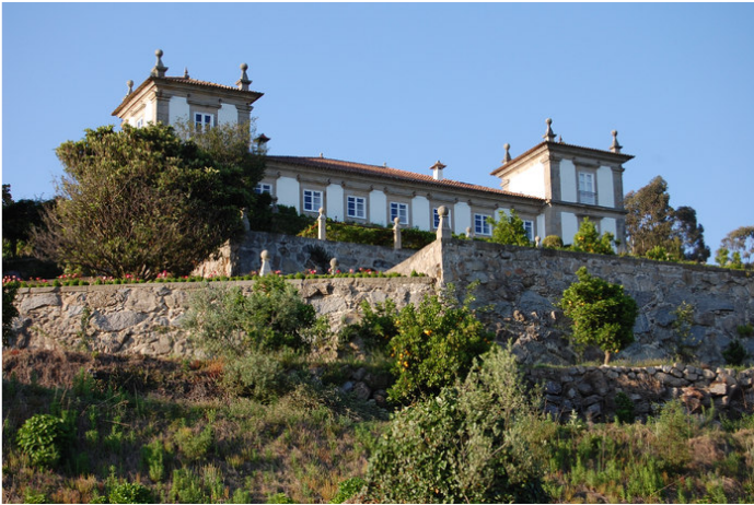
Paço de Calheiros, bij Ponte de Lima.