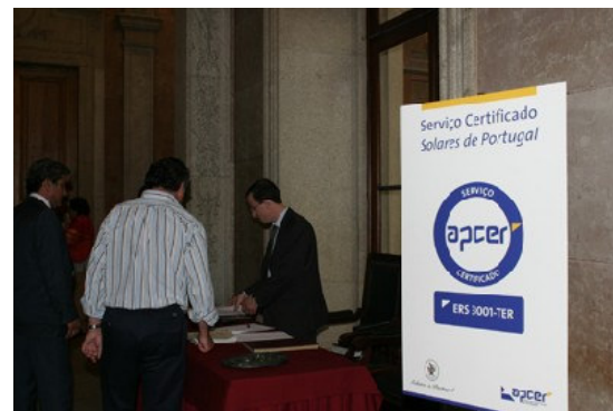
Serviço Certificado Solares de Portugal - ERS 3001 TER pela APCER