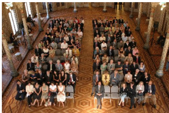
Assembleia geral na entrega dos Certificados aos Solares de Portugal pela APCER