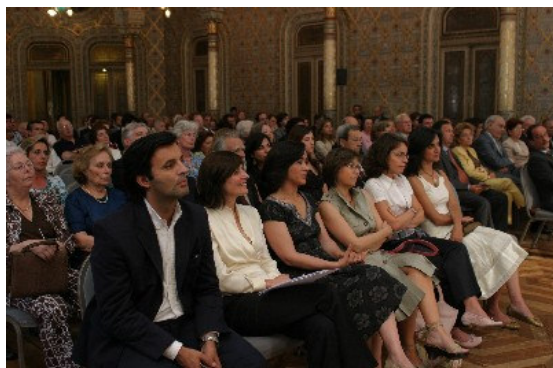
Assembleia geral na entrega dos Certificados aos Solares de Portugal pela APCER