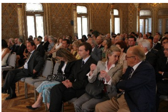
Assembleia geral na entrega dos Certificados aos Solares de Portugal pela APCER