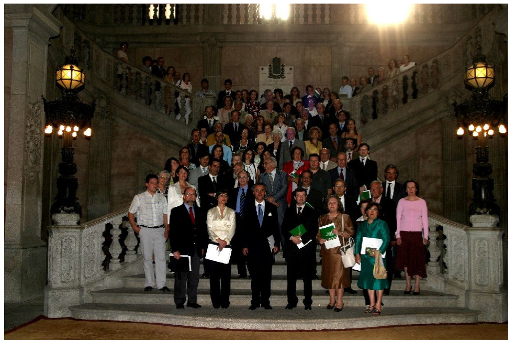
Associados da TURIHAB na entrega dos Certificados ERS 3001 TER – Turismo no Espaço Rural aos Solares de Portugal no Palácio da Bolsa - Porto

Cerimónia “Qualificação dos Solares de Portugal” – Palácio da Bolsa - Porto (02 de Junho de 2006) Certificação da Rede Solares de Portugal pela APCER com a ERS 3001 TER (Especificação de requisitos de serviço para o Turismo no Espaço Rural – Turismo de Habitação – Agro-Turismo – Turismo Rural – Casas de Campo)