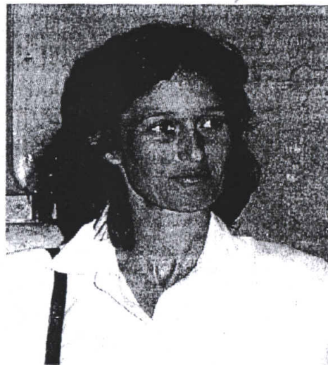
Faria de Oliveira (hoje) e Teresa Patrício Gouveia (amanhã): dois ministros "em turismo" no Minho